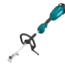
18 V LXT DUX18 Akumulatorska višefunkcijska glava