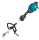
40 V Max XGT UX01GZ Akumulatorska višefunkcijska glava